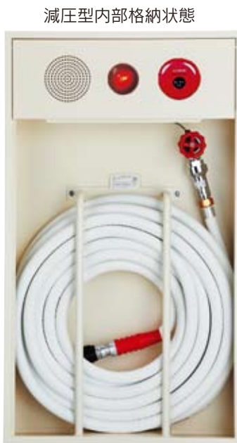
減圧型内部格納状態