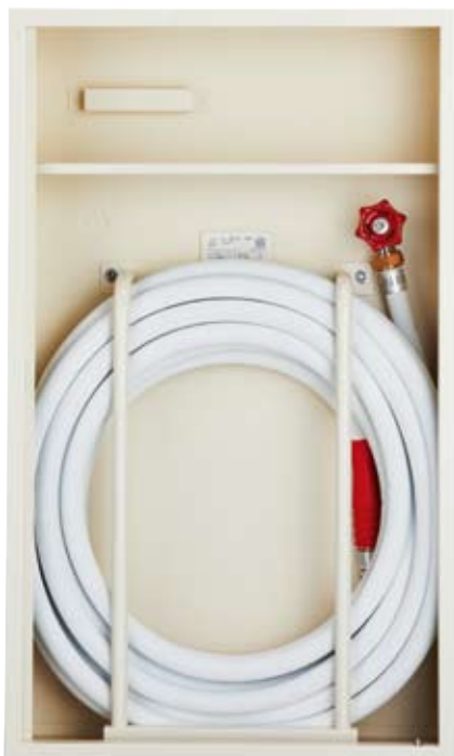
内部格納品 25Aユニット×1